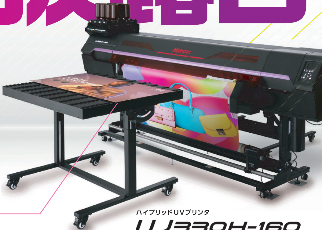
ハイブリッドUVプリンタ

金沢 4/27(月) 28(火) 10:00~17:00 [会場] ミマキエンジニアリング 金沢営業所