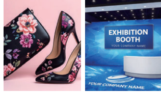
【合皮】靴・シューズ・ 車やバイクのシート等

今まで搬送が難しかったRoll素材 に対応ベルト搬送により、搬送性 がUP。透明メディアでもローラー 跡の心配なし。