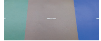
スジ・ムラを抑えた美しいベタ